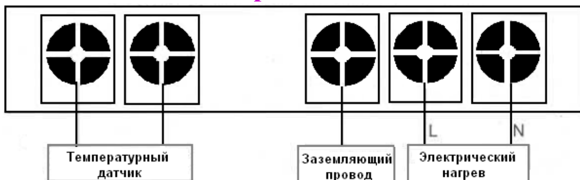
Схема электрических соединений

Прибор отличается стильным внешним видом благодаря черной блестящей верхней крышке. Контроллер имеет высокое качество и обеспечивает стабильные рабочие характеристики.